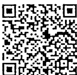
"เอกสารข้อ ๑"